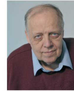
Eläkeläinen Pitäjänmäki Toiminut laboratoriomestarina ja työsuojelutoimikunnan puheenjohtajana teknillisessä korkeakoulussa.

Lisää palvelutaloja Helsinkiin. Vammairakentamisen määräykset koskemaan kerrostalojen rakentamista ja asuntojen saneeraamista.