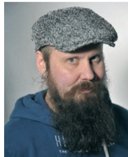
Muusikko Vuosaari www.facebook.com/vphakkarainen

Kaiken hyvän ja oikeudenmukaisuuden puolesta, kaikkea pahaa ja epäoikeudenmukaisuutta vastaan.