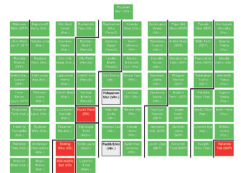
Valtuusto torjui äänin 79 - 4 budjetin työllisyysrahojen lisäämisen.

SKP ja Helsinki-listat haluaa ohjata kaupungin satojen miljoonien eurojen ylijäämistä rahaa helsinkiläisten hyvinvointiin. Helsingistä voidaan tehdä paljon nykyistä parempi kaupunki, jossa on hyvä elää niin duunarin kuin hoitajan, lasten kuin vanhusten, paljasjalkaisten stadilaisten kuin täältä turvaa hakevien.