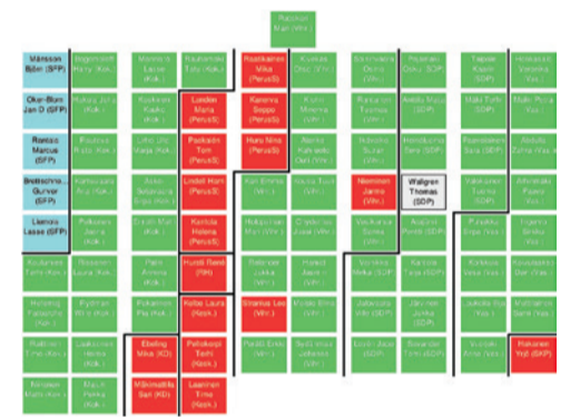
Viher- ja virkistysalueita tuhoavan yleiskaavan päätös uuteen valmisteluun hylättiin äänin 63-16.

SKP:n ja Helsinki-listojen mielestä yleiskaava pitää laittaa uusiksi. Keskuspuisto, Vartiosaari, Ramsinniemi, Helsingipuisto ja muut tärkeät viheralueet on suojeltava. Näin Helsinkiin voidaan perustaa laaja kansallinen kaupunkipuisto.