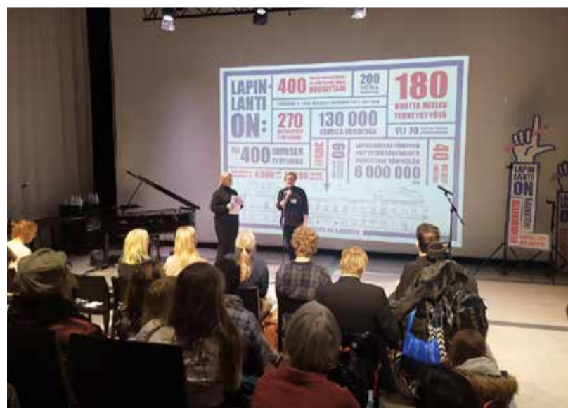
Lapinlahden entisen sairaalan rakennukset ja puisto kuuluvat kaikille. Niitä ei saa alistaa bisnekselle, vaaditaan kuntalaisaloitteessa, joka julkistettiin Oodissa.