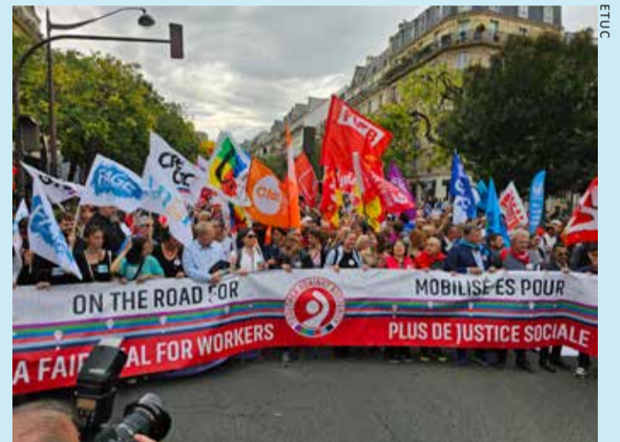
Eurooppalaiset ammattiliitot vastustavat leikkauspolitiikkaa ja vaativat oikeudenmukaisempaa kehitystä.