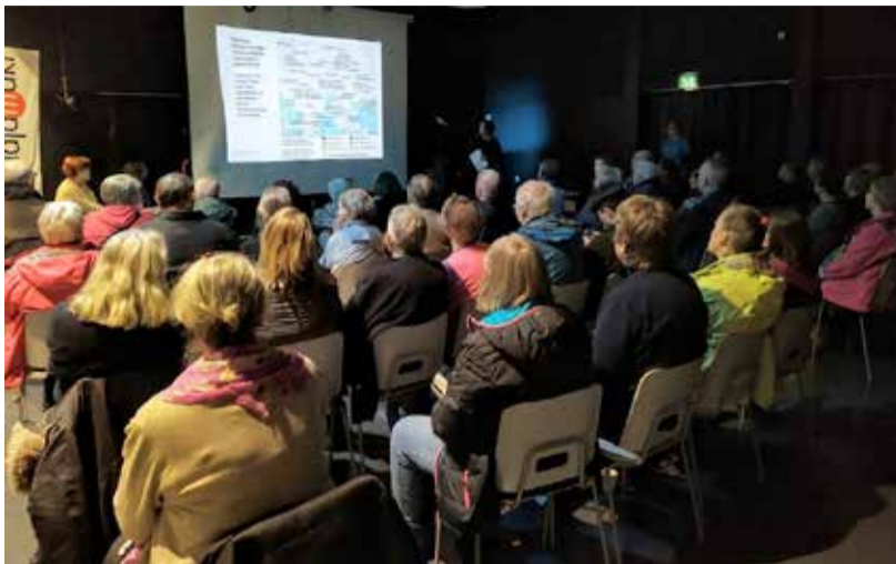
Nuorisotalon sali täyttyi Pihlajamäen terveysaseman puolustajista. Kysymyksiä herätti se, että kaupunki lopettaa lähterveysasemia samaan aikaan kun yksityiset yhtiöt lisäävät niitä ja alueelle rakennetaan paljon lisää asuntoja.

Pihlajamäki-seuran järjestämässä asukastilaisuudessa muistutettiin päättäjiä Kivikon terveysaseman kokeilusta, joka osoitti, miten jonot voidaan poistaa ja palveluja parantaa järjestämällä töitä toisin ja korjaamalla resurssipulaa. Myös