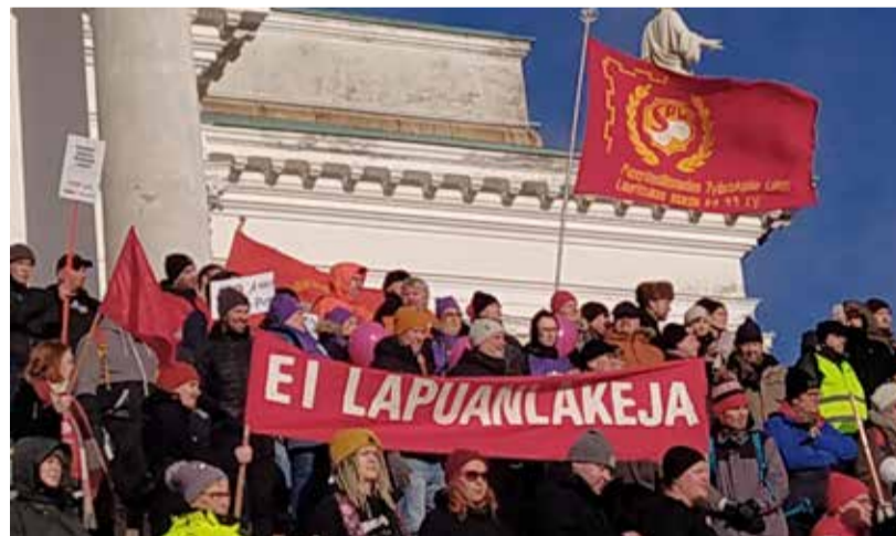
SAK:n ja STTK:n mielenosoituksessa Suurtorilla otettiin tiukasti kantaa lakko-oikeuden puolesta.

Orpon-Purran hallitus ajaa heikennyksiä työntekijöiden asemaan, ihmisten sosiaaliturvaan, koulutukseen, ympäristönsuojeluun ja moniin muihin tärkeisiin asioihin. Samalla se haluaa rajoittaa lakko-oikeutta vähentääkseen työntekijöiden mahdollisuuksia vastustaa heikennyksiä ja vaikuttaa päätöksiin.