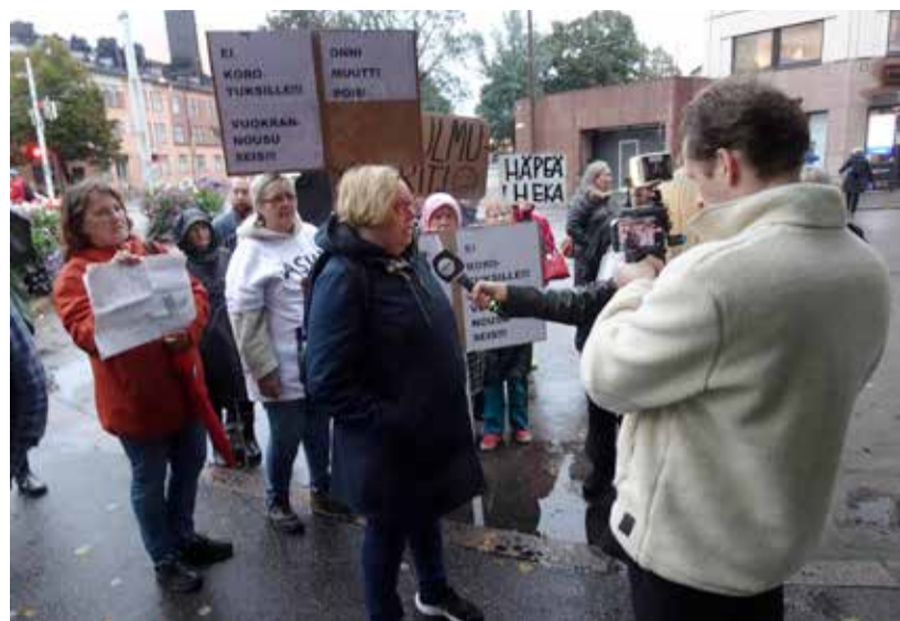
Asukkaiden toiminta sai päättäjät pienentämään HEKAn vuokrien korotuksia.

Helsingin kaupungin asunnot, eli HEKA, korotti viime vuonna vuokriin poikkeuksellisen paljon. Ilman asukkaiden sitkeää puolustustaistelua korotus olisi ollut vielä paljon suurempi. Asukkaiden yhteydenotot mediaan, erilaiset tapahtumat, mielenosoitukset ja mielipidekirjoitukset saivat kaupungin pääomittamaan omistamiaan HEKA:aa ja HASO:oa (Helsingin asumisoikeus Oy) yhteensä 20 miljoonalla eurolla.