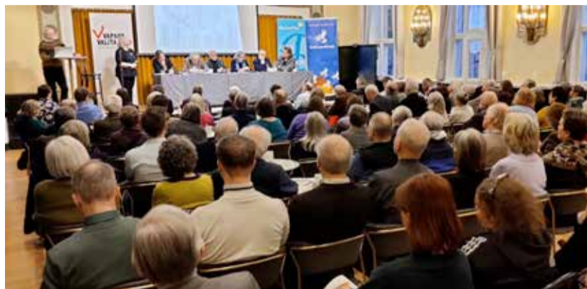
DCA-sopimuksen mukaan USA saa oikeuden tuoda Suomeen aseita ja joukkoja ilman, että sen tarvitsee sopia tästä enää mitään Suomen kanssa.

Eduskuntaan on tulossa Suomen ja Yhdysvaltojen välille neuvoteltu puolustusyhteistyösopimus (DCA). Siitä ei ole käyty juuri lainkaan julkista keskustelua, vaikka sopimus lisää jännitteitä Suomen itärajalta ja rajoittaa Suomen itsemääräämisoikeutta selvästi enemmän kuin Nato-sopimus.