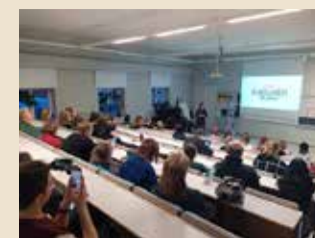
Yhteensiittymän julkistamistilaisuus oli Lapinlahdessa.