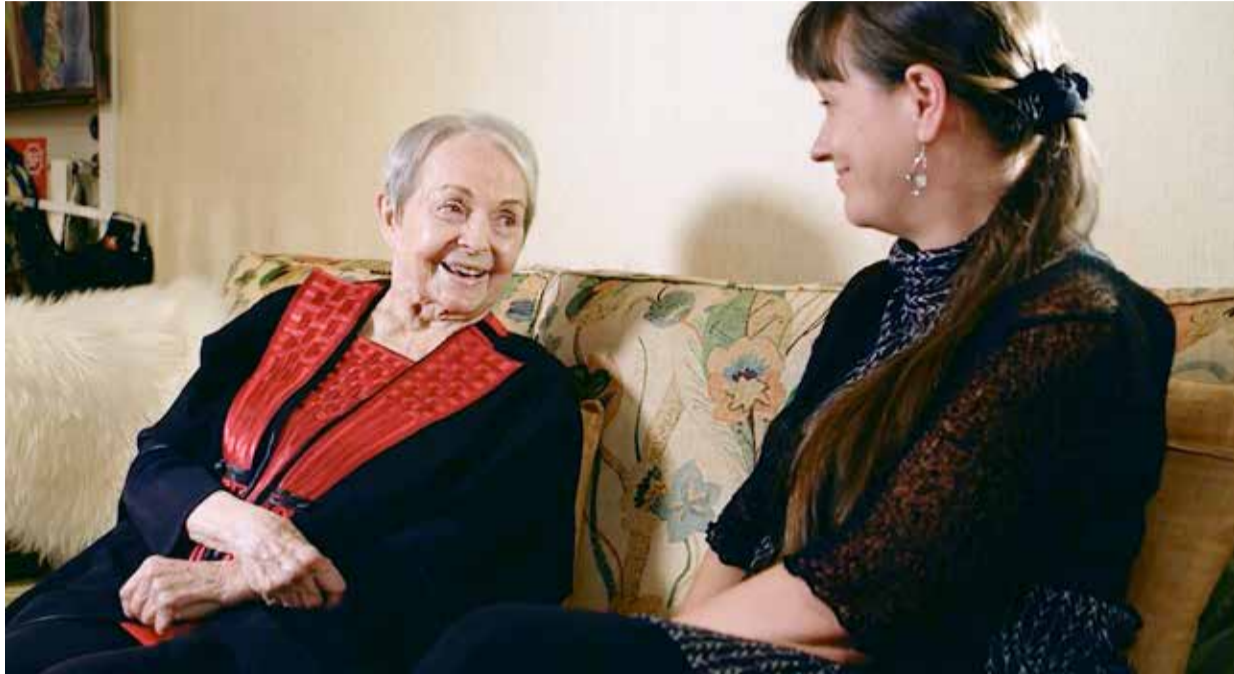
Dokumenttielokuvassa nähdään myös näyttelijälegenda Anneli Saulin ja ohjaaja Saara Cantellin hauskoja ja koskettavia keskusteluja.

Dokkari pohjautuu pitkälti Cantellin keskusteluihin Saulin kanssa ja tätä myötä näyttelijälegendan omaan kertomaan. Mukana on myös paljon arkistomateriaalia, kuten pätkiä vanhoista elokuvista ja mainoksista.