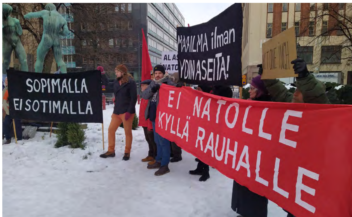
Mielenosoittajat kertoivat Helsingissä käyneelle Naton pääsihteerille, että kaikki suomalaiset eivät toivota Natoa tervetulleeksi.

Samalla kun tuomitaan Venäjän laiton hyökkäyssota, on samoilla perusteilla arvioitava myös muita maita, esimerkiksi Israelin miehityspolitiikkaa Palestiinassa ja Turkin tekemiä iskuja Irakin ja Syyrian kurdialueille, toteavat läntisen ja pohjoisen Helsingin SKP:n osastot lausumassaan.