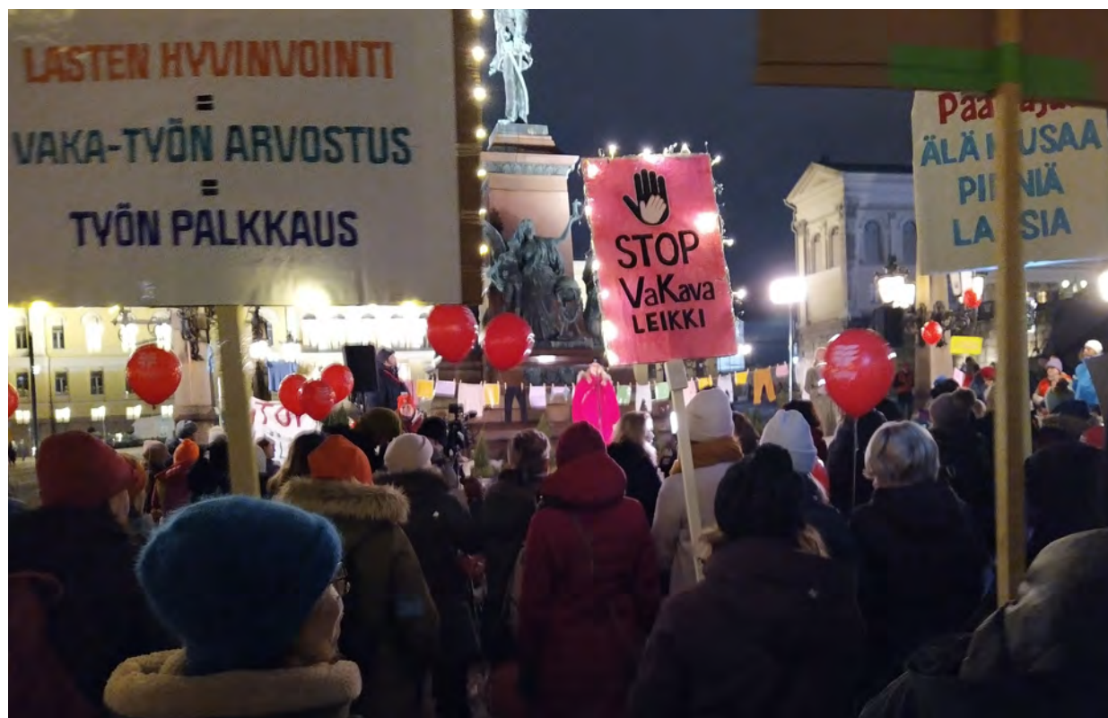
STOP VaKava leikki -mielenosoituksessa vaadittiin kaupunkia ja valtiota osoittamaan lisää resursseja mm. varhaiskasvatukseen.

Helsingin kaupungille kertyi viime vuonna yli 300 miljoonaa euroa enemmän tuloja kuin budjetissa arvioitiin. Alustavan tilinpäätöksen mukaan viime vuoden tulos on 364 miljoonaa ylijäämäinen.