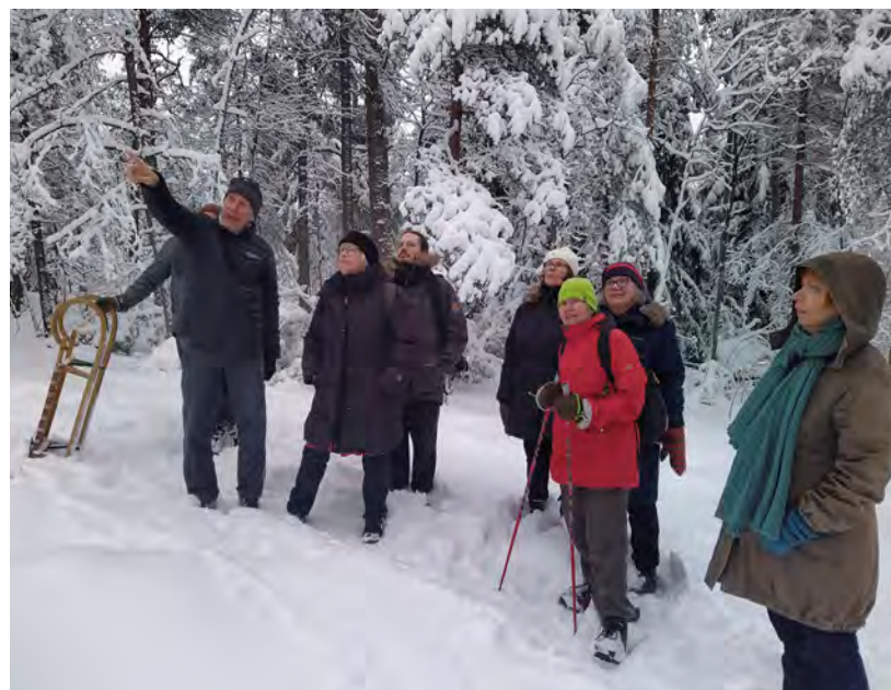
SKP ja sitoutumattomat järjestivät laskiaissunnuntaina kävelyretken Malminkartanon uhanalaiseen, koskemattomaan Kartanonmetsään.

Luontokato on yhtä lailla ihmisten hyvinvointia uhkaava ilmiö kuin ilmastomuutos.