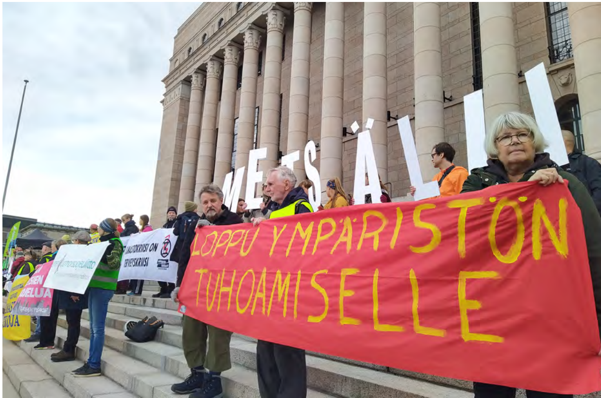
Metsämarssilla vaadittiin eduskuntaa vahvistamaan metsien suojelua ja hiilinielua.

Lajikato liittyy ilmastomuutokseen. Kutistuva ja köyhtyvä luonnonympäristö, talvisin sulava lumi ja jää ahdistavat Suomen alkuperäisiä eläimiä, kasveja, hyönteisiä. EU:n jäsenmaat ovat sitoutuneet luontokadon pysäyttämiseen ja kehityksen kääntämiseen vuoteen 2030 mennessä. Suomessa valtiolta odotetaan tositoimia: lisää suojelualueita ja elin-