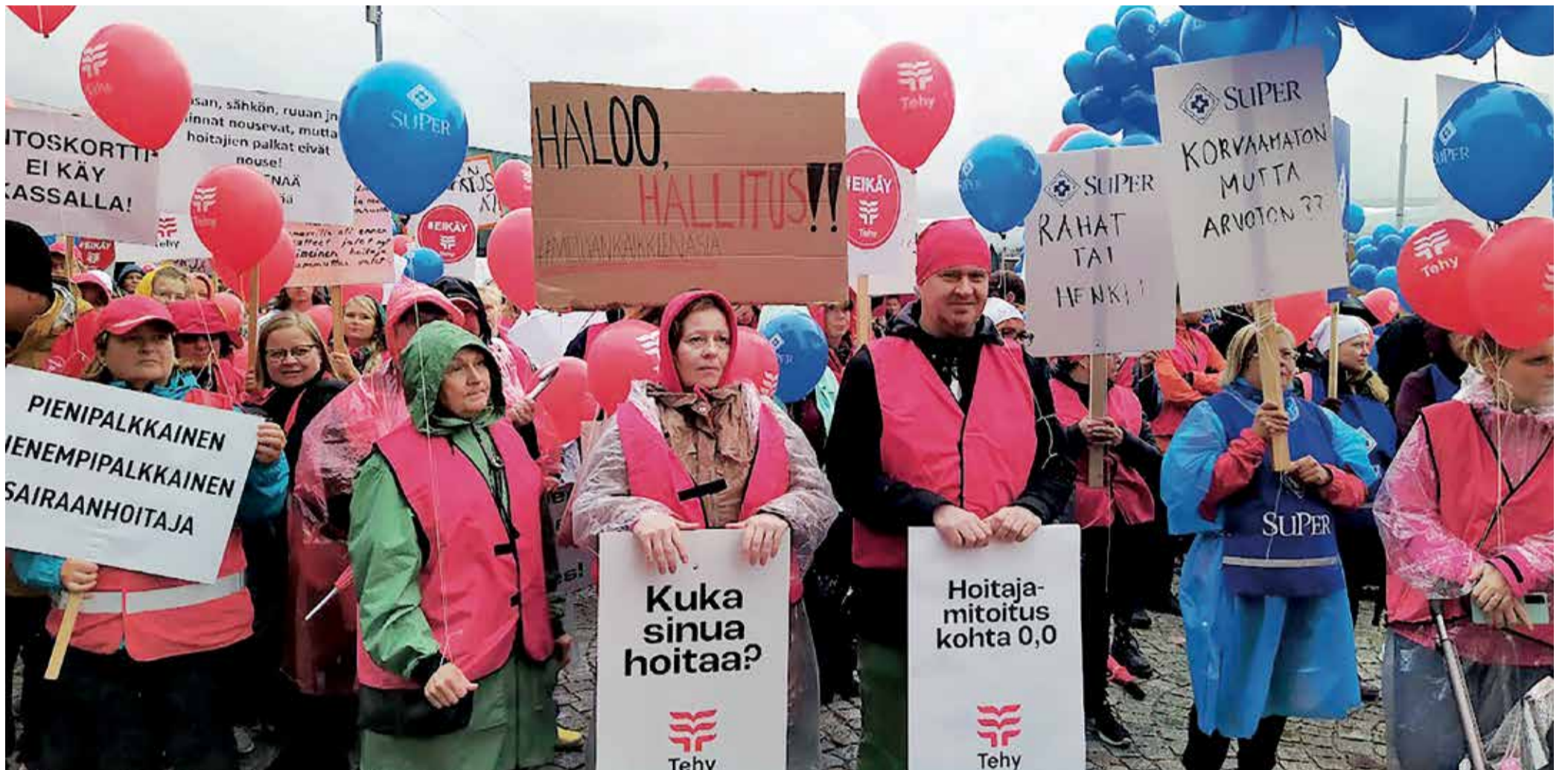
Superin ja Tehyn mielenosoitus pakkotyöläkää vastaan 16.9.2022

– Pahenevaa hoitajapulaa ei ratkasta pakolla vaan rahalla ja työoloja parantamalla. SDP:n ja Vasemmistoliiton tuki pakkotyölle jää mustaksi luvuksi työväenliikkeen historiaan, piirikomitean lausumassa todetaan.