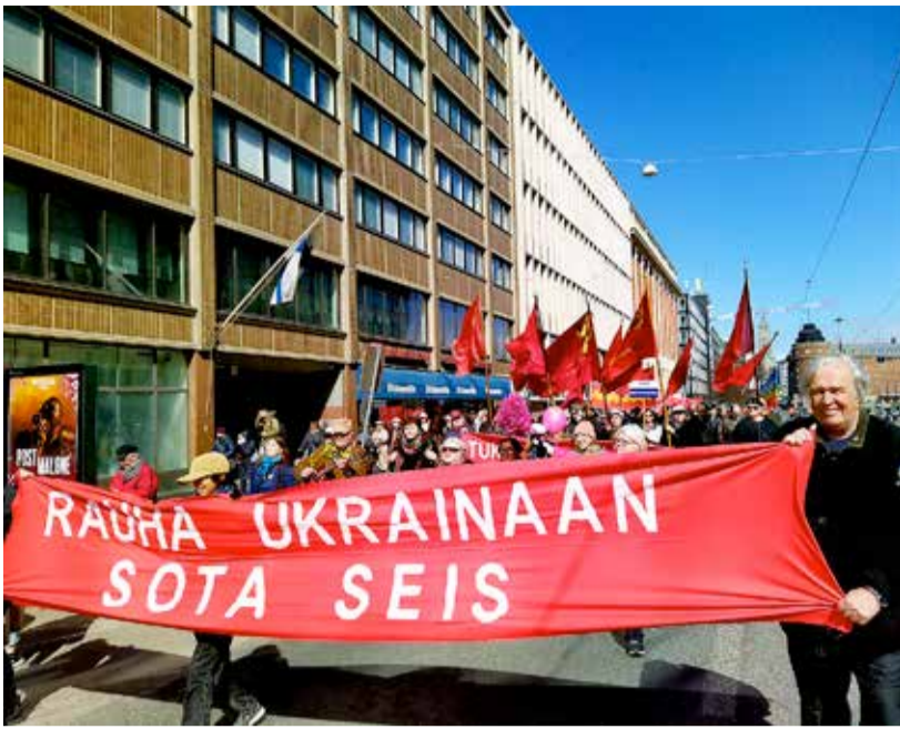
Venäjän hyökkäys Ukrainaan tuomittiin myös vappumarssilla.