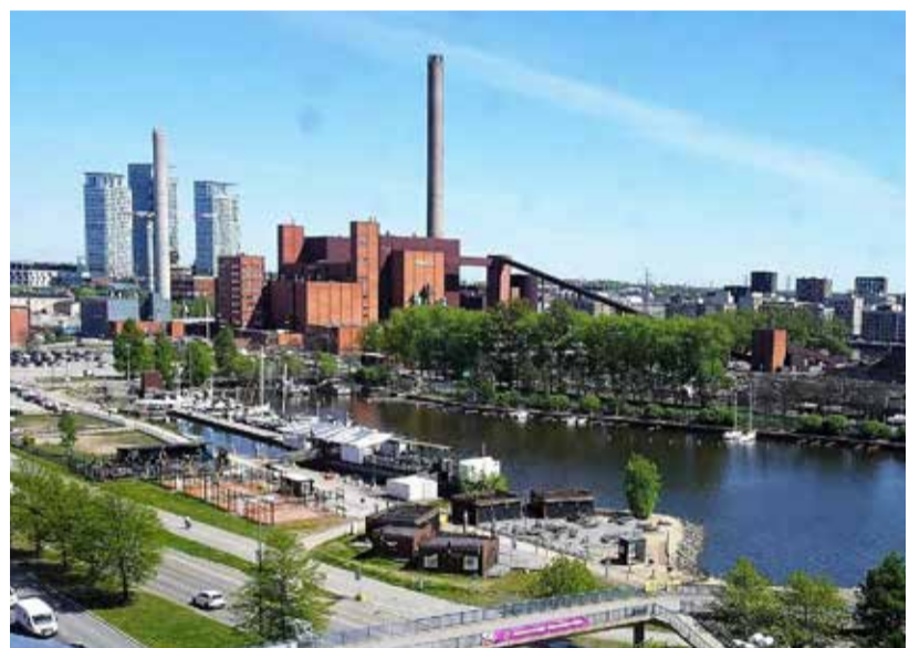
Helen tuottaa helsinkiläisille sähköä ja lämpöä muun muassa Hanasaarella.

Sähkön ja muiden energiamuotojen hinta on noussut viime aikoina rajusti. Syynä hinnankorotuksiin ei ole tuotantokustannusten nousu vaan ennen kaikkea erilaisissa pörseissä tapahtuva keinottelu. Esimerkiksi sähkön hinta määräytyy pohjoismaisessa Nord Pool -sähköpörssissä, jota operoidaan Norjasta ja jossa on mukana myös Baltian maita ja jota hallitsee eurooppalainen pörssi-yhtiö Euronext.