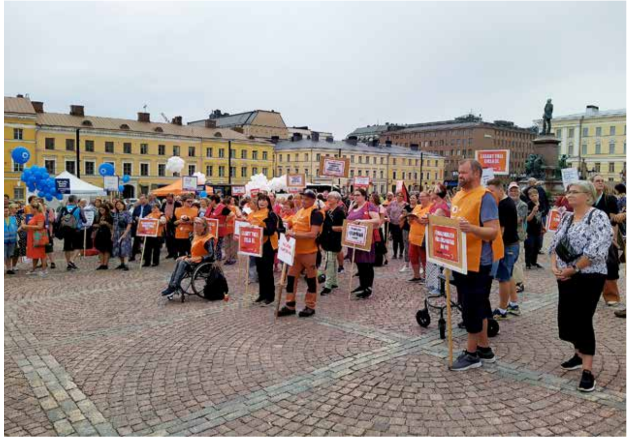
Eräpäivä-mielenosoituksessa elokuussa vaadittiin Helsingin palkkasotkun korjaamista heti.

Ei ole kauan siitä, kun Helsingistä rakennettiin ”maailman toimivinta kaupunkia”. Tämä ei näy ainakaan kaupungin palkanmaksussa ja henkilöstöhallinnossa. Tuhansille työntekijöille on maksettu palkkaa liian vähän tai väärin, monet ovat jääneet jopa ilman palkkaa. Eikä huhtikuun alussa alkaneelle sotkulle näy loppua.