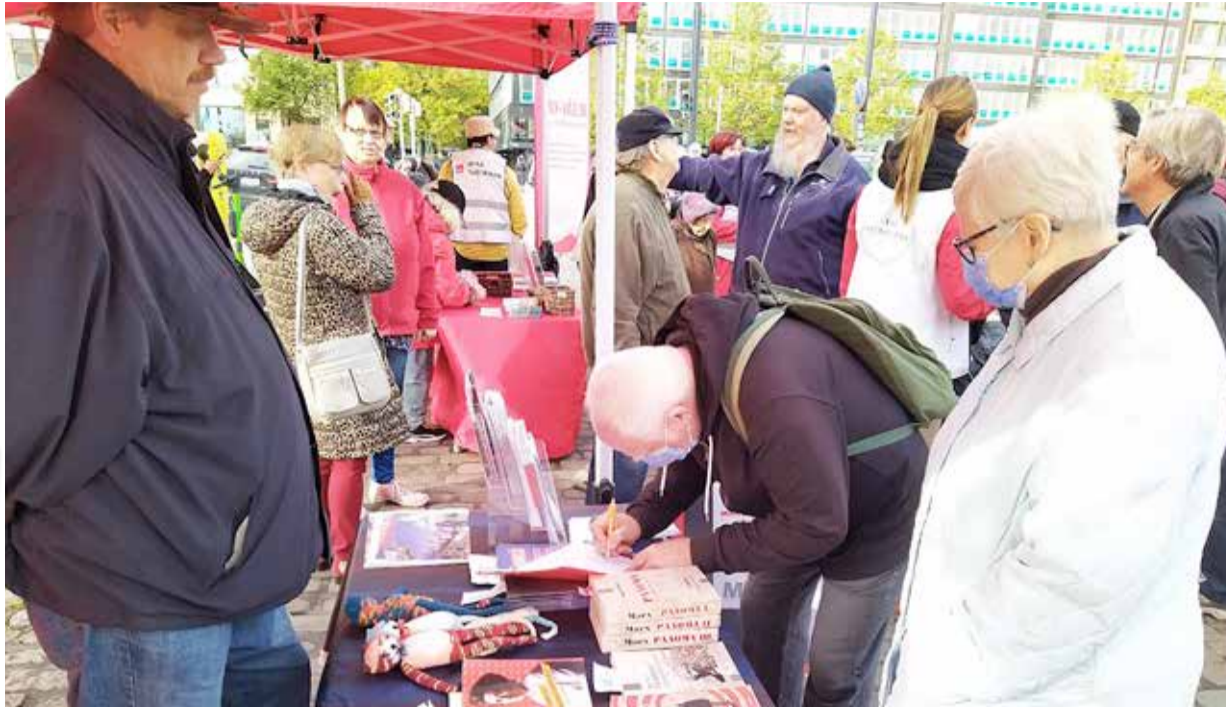
Hakaniemen markkinoilla kerättiin nimiä kuntalaisaloitteeseen Helen Oy:n helsinkiläisiltä perimien sähkön hintojen alentamiseksi.

Hintojen korotuksiin on monia syitä, joista dramaattisin on Ukrainan sota. Koko energiajärjestelmä on kriisissä, joka alkoi jo ennen sotaa ja näkyi erityisesti sähköpörssin hintojen nousuna.