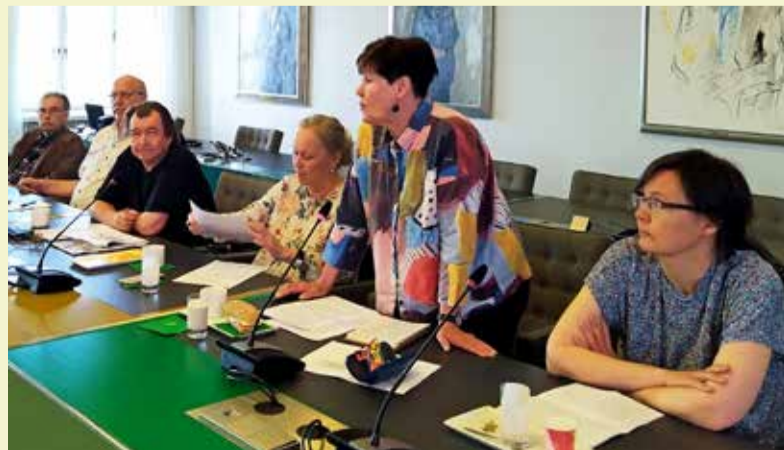
Maunulan, Oulunkylän, Pakilan, Paloheinä-Torpparinmäen, Pihlajamäen ja Pirkkolan kaupunginosayhdistysten lähetystö vetoamassa sote-lautakuntaan lähiterveysasemien puolesta.

”Pajusen lista” pysäytettiin aikoinaan asukasliikkeiden laajalla yhteistyöllä, jota myös monet kaupungin työntekijät tukivat. Myös nyt tarvitaan yhteistä toimintaa lähipalvelujen puolesta.