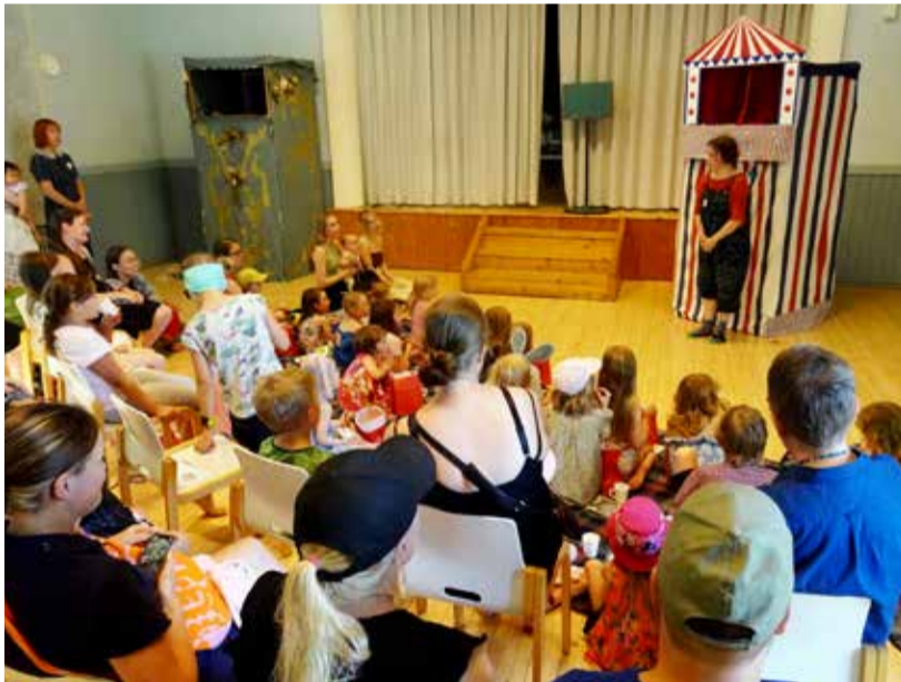
Nukketeatteritalolla on esityksiä niin lapsille kuin aikuisille.