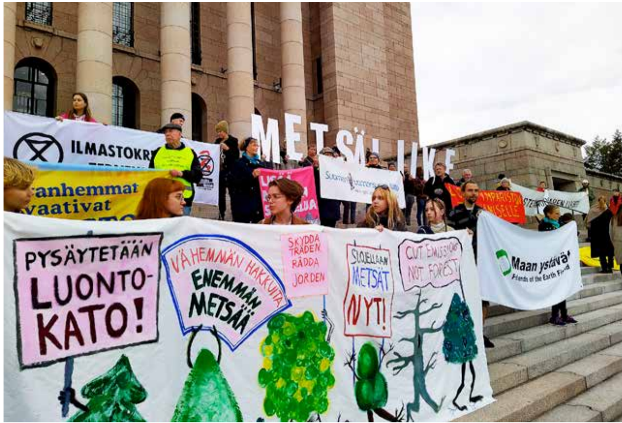
Metsien hiilinielujen ja luonnon monimuotoisuuden romahdus kokosivat syyskuussa tuhansia osallistujia metsämärssille useilla paikkakunnilla.

Karl Marxia mukaillen kapitalismissa luonnosta tulee ihmisille pelkkä kohde, pelkkä hyödyn asia ja lisäarvon määrällinen raja ilmenee kapitalismissa vain luonnon asettamana rajoituksena. Kapitalismin oloissa revitään maahan kaikki rajoitukset, jotka jarruttavat tuotantovoimien kehitystä, tarpeiden laajentamista, tuotannon kasvua ja luonnon hyväksikäyttöä. Ylimääräiset voitot virtaavat niiden taskuihin, jotka ehtivät ensimmäisinä hyödyntämään uudet tieteelliset löydöt.