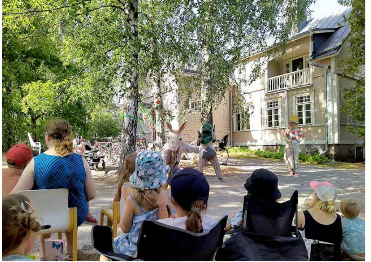
Kaksikymmentä nukketeatteritaiteilijaa on perustanut Nukketeatteritalon Pakilan työväentalolle.

Työväentalon oma järjestö- ja kulttuuritoiminta on jatkunut kaikkina näinä vuosikymmeninä, vaikka Pakila on keskiluokkaistunut. Aatteelliset kokoukset, juhlat, vappulounaat ja muut tilaisuudet elävöittävät ja elävöittävät myös pihapiiriä.